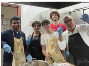
La parte sempre aperta

L'impaginazione e l'editing sono di Roberto Villino. POLIEDRO è liberamente scaricabile senza limiti di diffusione.