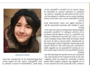
Violenza contro le donne, non c'è tregua