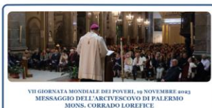
Caritas, Caritas, Caritas