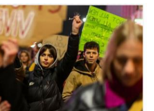
Violenza contro le donne, non c'è tregua